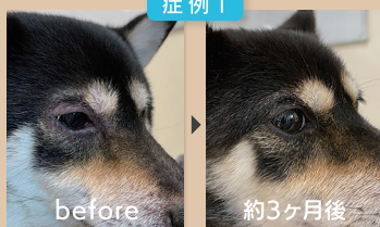
目の周りが脱毛して赤みを帯び、非常に痒みを伴う臨床症状が約3ヶ月で改善しました。