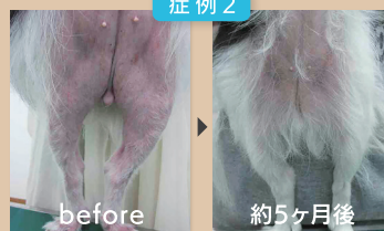
四肢を非常に痒がるという症状がありましたが薬を使うことなく改善しました。