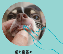
歯と歯茎の間にスリスリ