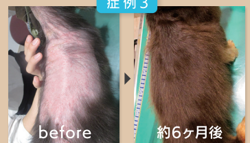
背中に大きな脱毛が認められましたが、痒みも止まり、脱毛も改善されました。